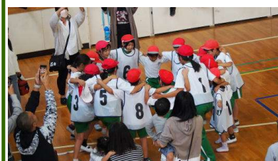
(優勝した若葉町チームの円陣)

10月8日に船迫地区子ども育成会球技大会育成会球技大会が行われました。令和4年度は新型コロナウイルス感染症防止のため中止となったため、2年振りの開催となりました。高学年の児童を狙ってビーを果敢に投げ