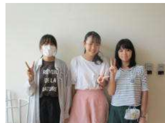
頑張れ！ NBK LOVE♡