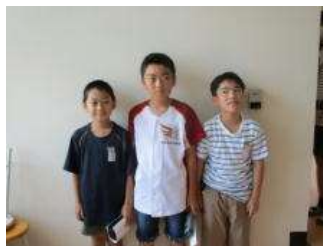
頑張れ！ マス・キング

9月16日に算数チャレンジ2023(宮城県教育委員会主催)が行われます。県内511チームで行われた予選を通過した33チームで、県内No.1チームを競います。本校からは、2チームが選ばれ出場します。夏休み後に休み時間や放課後に問題練習をしてきました。No.1を目指して頑張ってください。