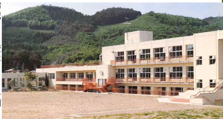
↑開校当時の船迫小学校 ↓船迫分校(昭和30年頃・船迫下町)

6年に完成したということです。上の表は開校からの13年間の児童数の記録ですが、現在の船迫小学校よりも、たくさんの児童が通っていたことがわかります。児童数が急増した時代ということですが、現在の児童数346名の2倍の人数が通っていたようです。支校や分校を含めると長い歴史のある船迫小学校です。児童にはぜひ、誇りを持って学習に運動に励んでほしいです。そして、これからも続く船迫小学校の歴史の中に、誇れる新しいものを刻んでほしいです。ご家族や地域の方々には船迫小学校の歴史に詳しい方がいれば、ぜひ児童とともにお話しいただきたいと思ひます。