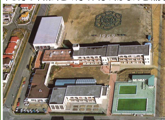
↑開校10周年を迎えた船迫小(平成元年)

6年に完成したということです。上の表は開校からの13年間の児童数の記録ですが、現在の船迫小学校よりも、たくさんの児童が通っていたことがわかります。児童数が急増した時代ということですが、現在の児童数346名の2倍の人数が通っていたようです。支校や分校を含めると長い歴史のある船迫小学校です。児童にはぜひ、誇りを持って学習に運動に励んでほしいです。そして、これからも続く船迫小学校の歴史の中に、誇れる新しいものを刻んでほしいです。ご家族や地域の方々には船迫小学校の歴史に詳しい方がいれば、ぜひ児童とともにお話しいただきたいと思ひます。