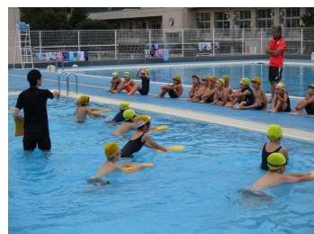
プールでの学習（1年）