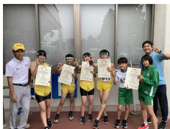
陸上リレー県3位（6年）