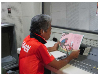
給食時間の読み聞かせ